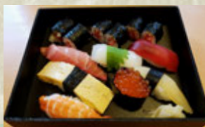
お持ち帰り鮎 粉引 ¥2,484