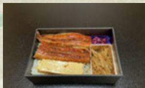
うなぎ弁当 (要予約) ¥2,500