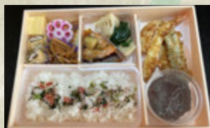
えんお弁当 3個〜 ¥1,500