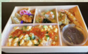
バラちらし 3個〜 ¥2,000