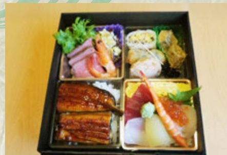
月 会食におすすり ¥3,800 ご注文は3日前まで5個より承ります。

※各お値段は税込み価格にて表記させて頂いております。 ※各写真は、イメージになります。