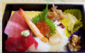
ちらし鮎 粉引 ¥2,700