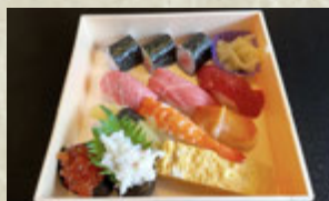
お持ち帰り鮎 織部 ¥3,672