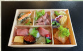
お鮎弁当 (要予約) ¥4,000